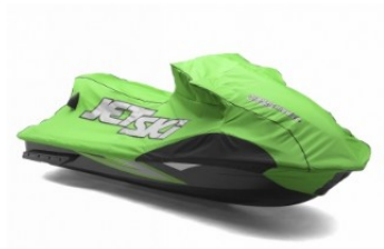
BACHE € 336,00