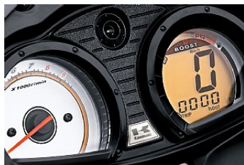
Compte tours et écran LCD