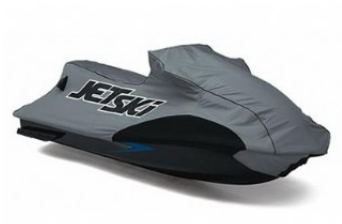
BACHE € 319,00