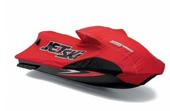
BACHE ULTRA250X € 279,00